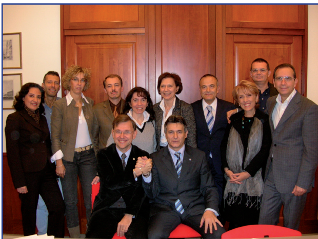
Figura 1. Gruppo Scuola AMD nel Biennio 2009-2011.

Scopo del lavoro è quello di valutare le attività realizzate dalla Scuola Permanente di Formazione Continua AMD nel biennio 2009-2011 dopo il Riesame del-